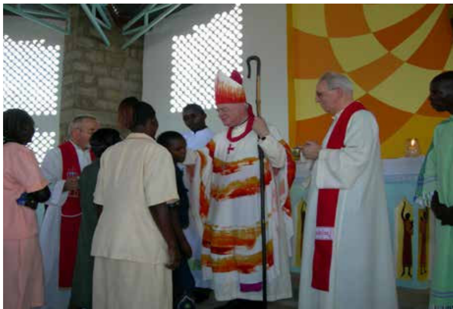
IRIAMURAI - gennaio 2006: Visita di mons. Ravignani alla missione del Kenya. Amministrazione della S. Cresima a giovani e adulti

Così aveva sperimentato l'atteggiamento più opportuno del pastore nella diocesi di Vittorio Veneto dal 1983, così continuò nella Trieste che conosceva bene, perché vi era cresciuto, e dalla quale fu atteso con gioia come successore del compianto Lorenzo Bellomi. Molti lo videro come il successore naturale.