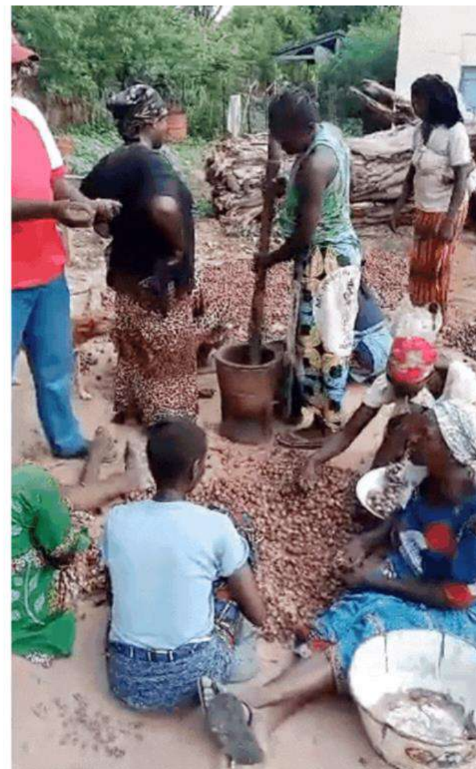
Fase della lavorazione del karité